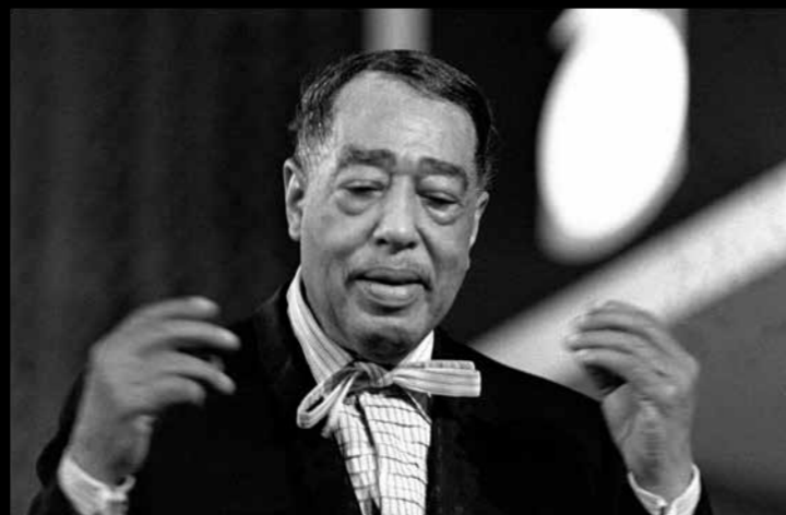
Duke Ellington (1899–1974) – Mezinárodní jazzový festival Praha 1968