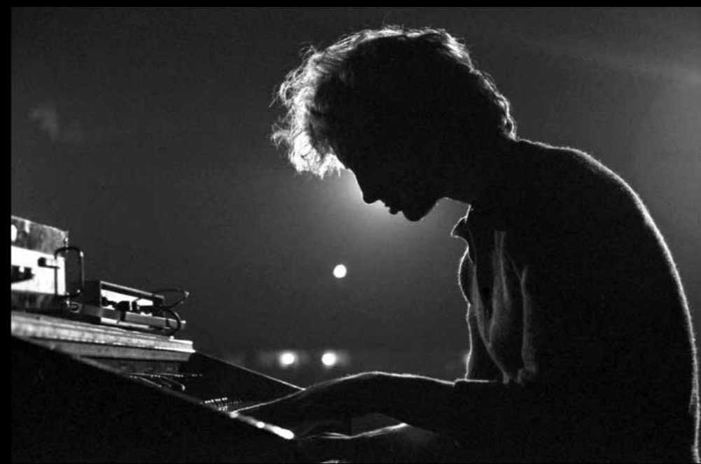
Marián Varga (1947–2017) – Collegium Musicum, 3. Beat Festival Praha 1971