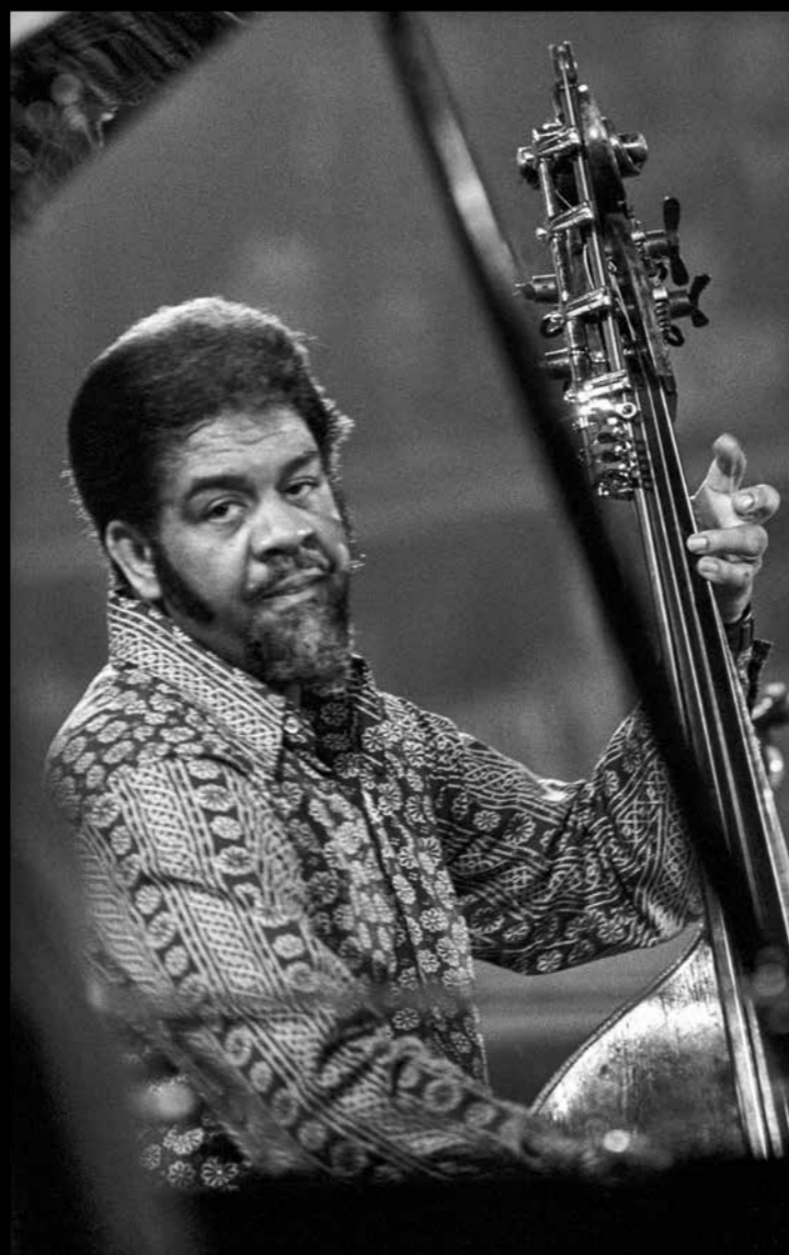
Al McKibbon (1919–2005) – The Giants of Jazz, Mezinárodní jazzový festival Praha 1971