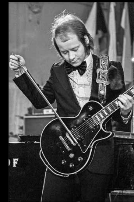
Radim Hladík (1946–2016) – Blue effect, 3. Beat Festival Praha 1971